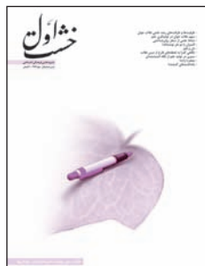
۱. طلاب جوان و تولید علم