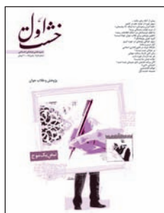
۵ و ۴. پژوهش و طلاب جوان