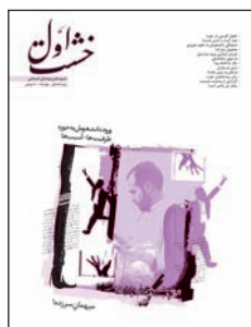
۴. ورود دانشجویان به حوزه