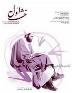
۳ و ۲. هویت روحانیت و طلاب جوان