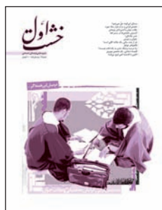
۷. بررسی رویکردهای نظری تخصص گرای، گرایش تحصیلی و طلاب جوان (۱)