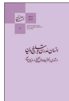
۱. انسان مدرن و تبلیغ دین