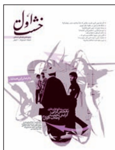
۸. بررسی رویکردهای نظری تخصص گرای، گرایش تحصیلی و طلاب جوان (۲)